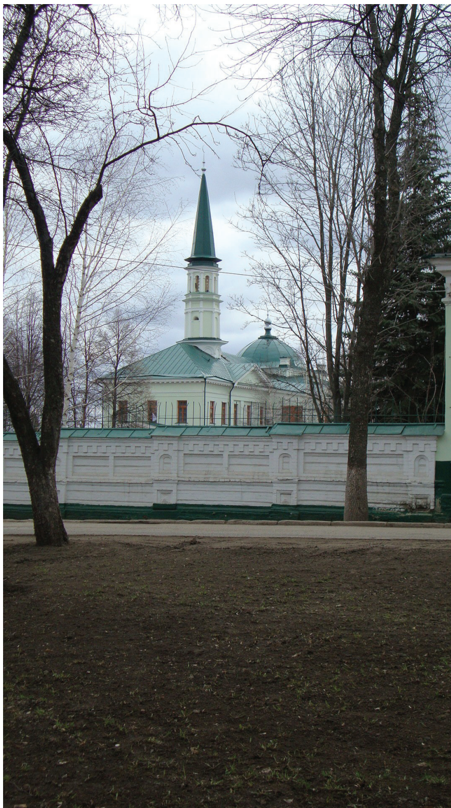
Рис. 3. Мечеть Оренбургского магометанского духовного собрания в Уфе. Построена в 1890-е гг.