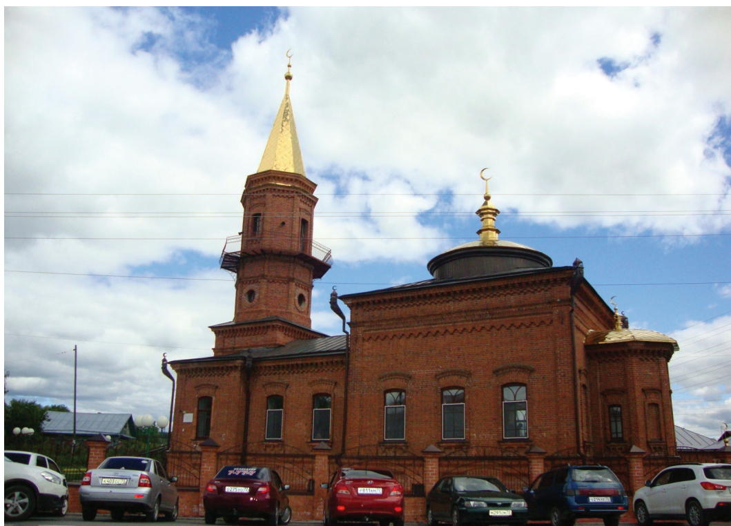
Рис. 2. Соборная мечеть в Тобольске. Построена на рубеже XIX–XX вв.