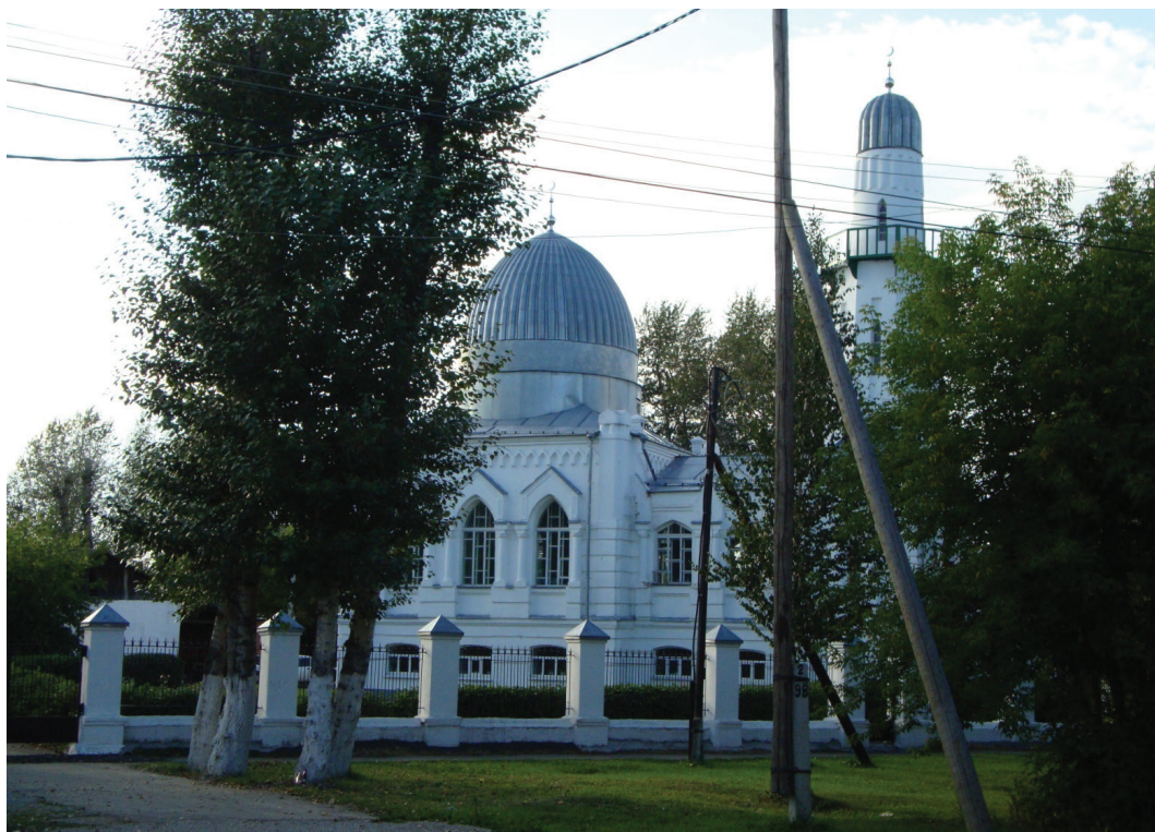
Рис. 1. Белая соборная мечеть в Томске. Построена в 1913 г.